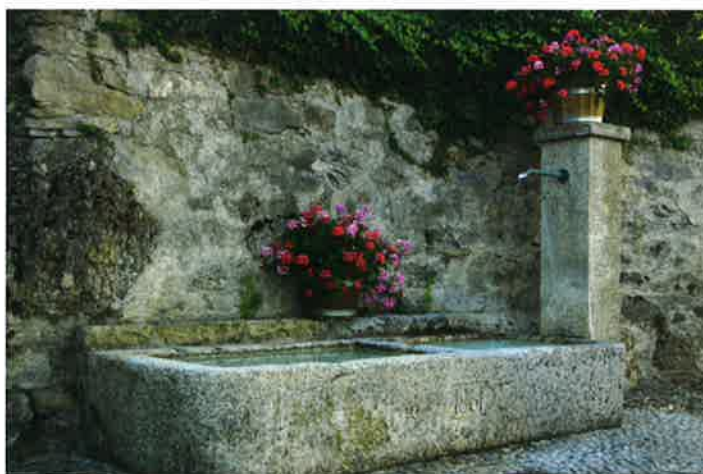
La fontaine «du grand-père», Rue Jacques-Chardonne