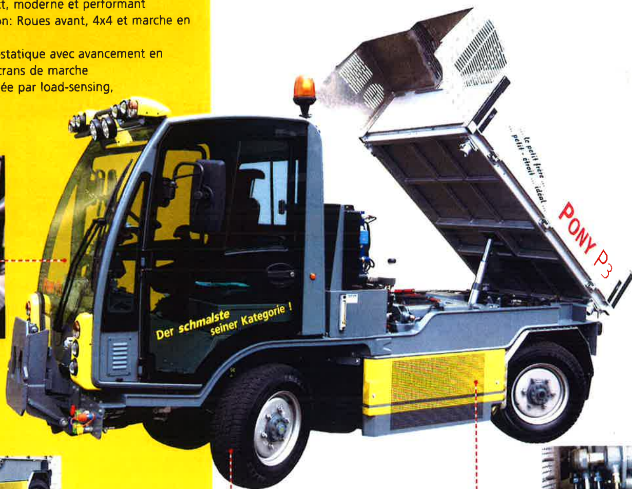
Cabine confort avec Joystick