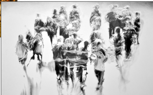
« Combien étaient-ils ? » 70cm x 50cm, réalisé en 2011

Informations et détails sur : www.didiermouron.com