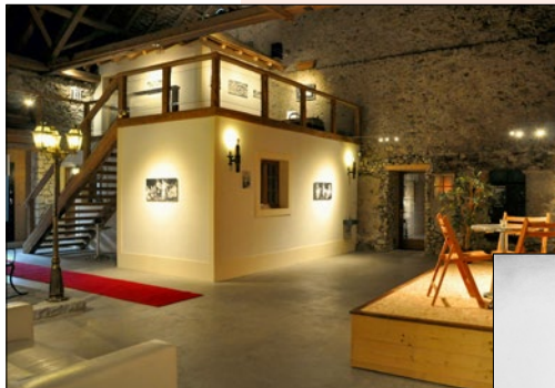
L'Espace DM (l'atelier actuel) à Giez près de Grandson

Informations et détails sur : www.didiermouron.com